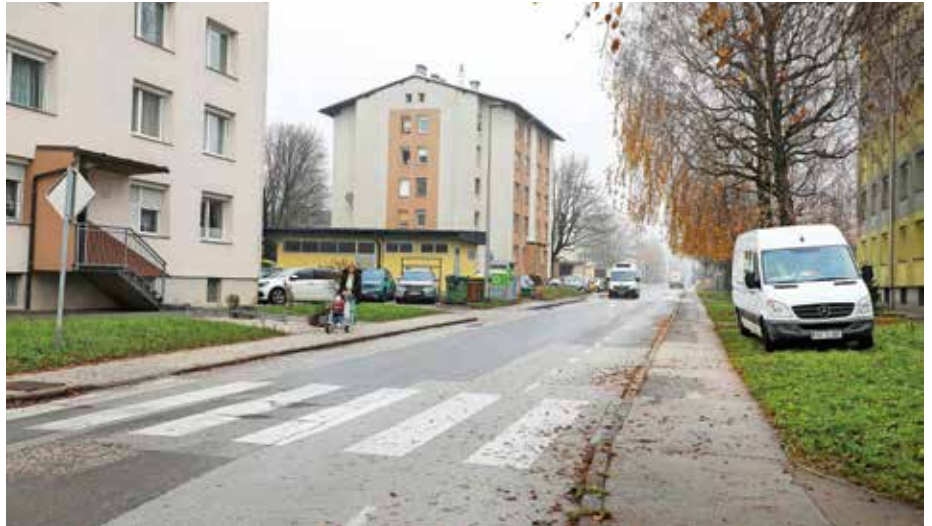
Ob uvedbi enosmernosti na delu Zoisove ulice bi pridobili tudi 18 parkirnih mest ob robu vozišča.

Mestna občina Kranj je v začetku leta naročila mobilnostno študijo, v kateri je predlagana uvedba enosmernega prometa tudi na dveh ulicah na območju krajevne skupnosti Vodovodni stolp. V študiji je tako predlagana preureditev dela Zoisove ulice (med Nazorjevo ulico in Oldhamsko cesto) v enosmerno. Dovoljena smer vožnje bi bila v smeri proti Oldhamski cesti. Širina Zoisove ulice (šest metrov) omogoča, da hkrati z vzpostavitvijo enosmernega režima uredijo še 18 parkirnih mest ob robu vozišča. Enosmerni promet je predlagan tudi za Valjavčevo ulico, ki poteka okoli stanovanjskih objektov. Smer vožnje je prav tako predvidena v smeri od juga proti severu. Po besedah Marka Čehovina je bila uvedba enosmernega prometa predvsem na Valjavčevi ulici predlagana tudi že v preteklosti, predvsem