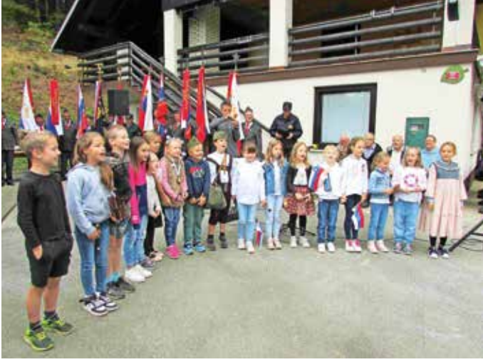
Lovska kočica LD Storžič je bila tudi letos gostiteljica Partizanskega mitinga Združenja borcev za vrednote NOB Kranj.

barakah je živel do 180 borcev. Baza 20 je zaščitena kulturni spomenik. Izlet smo popestrili tudi z vodenim ogledom lepo urejenega gradu Žužemberk ter vodenim ogledom Jurčičeve domačije na Muljavi. Druženje smo zaključili s kosilom v znani gostilni Pri Obrščaku na Muljavi.