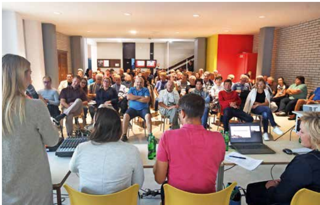
Srečanje krajanov krajevne skupnosti Vodovodni stolp z županom Matjažem Rakovcem je potekalo 12. oktobra.

Glede severne obvoznice je župan povedal, da je obstoječa trasa zanj rezervirana že od leta 2010, Krajevna sku-