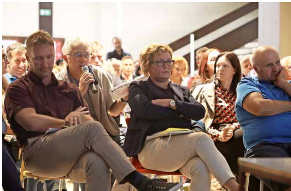
Krajani so večinsko nastopili proti pozidavi Rupovškega polja.

pnost Primskovo pa je leta 2016 podala pobudo, da se premakne severneje, čez Rupovško polje. »Dam pa vam besedo, da te pobude ne bomo dali naprej, ker smo dobili namig, da ta severna severna obvoznica ne bo šla skozi pri vseh