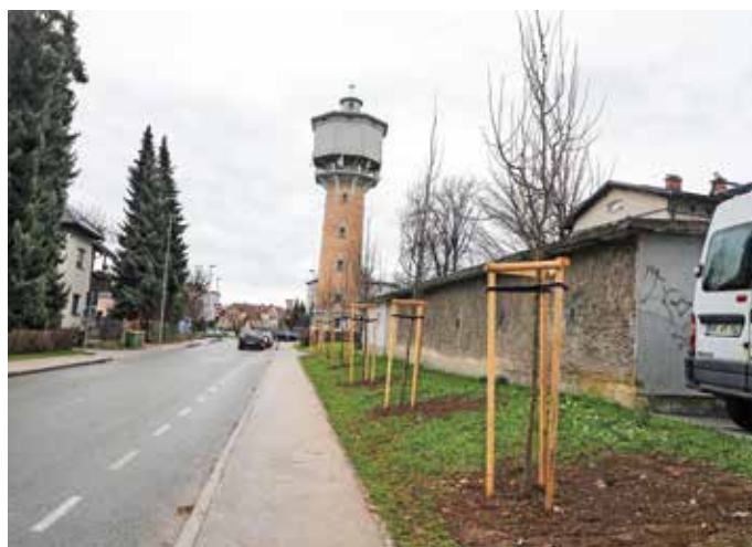
Novozasajena drevesa ob Cesti Kokrškega odreda bodo morali odstraniti.

V začetku decembra so ob Cesti Korškega odreda zasadili nov drevored. A kot kaže, novozasajene sadike ne bodo imele priložnosti zrasti v odrasla drevesa. Iz Mestne občine Kranj so namreč Krajevno skupnost Vodovodni stolp obvestili, da se je ob zasaditvi izkazalo, da je lokacija plinovoda drugačna, kot je vrisano v katastru. Iz tega razloga bo treba drevored odstraniti.