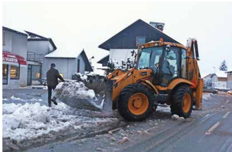
Zimsko službo na lokalnih in mestnih cestah ter ulicah in javnih poteh v Kranju izvaja Komunala Kranj. Slika je simbolična.

V primeru, da v 24 urah zapade več snega in da je sneženje še napovedano, se vsa mehanizacija preusmeri na pluzenje cest, po katerih potekajo proge javnega mestnega prometa, in tistih cest, ki so pomembne za tranzit, dovoz do šol, vrtcev, bolnišnic, reševalne postaje in podobno. Vse ostale ceste se očistijo v najkrajšem možnem času po prenehanju padavin. Tudi površine za pešce se čistijo po prioriteten programu. V centru mesta in ob avtobusnih progah ter lokalnih glav-