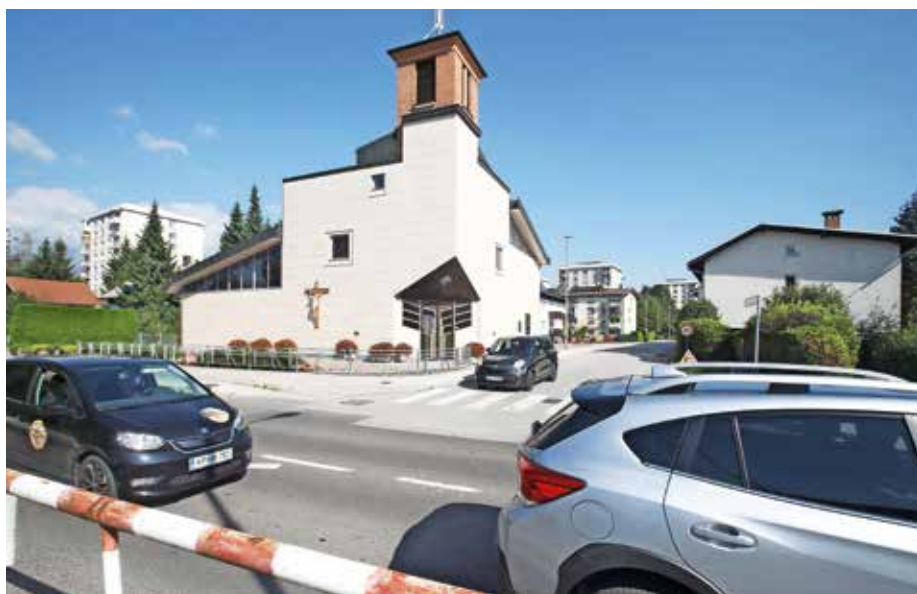
V križišču Ulice XXXI. divizije in Bleiweisove ceste načrtujejo postavitve semaforja.

Z MOK so odgovorili, da je za križišče Ulica XXXI. divizije – Bleiweisova cesta pripravljena idejna zasnova v sodelovanju z Direkcijo RS za ceste, ki predvideva postavitve semaforja na križišču. Kdaj bodo semafor postavili, pa ne morejo napovedati, ker gre za območje, ki prehaja v državno cesto in s tem za državno investicijo, zaradi letošnjih poplav pa se določeni projekti na državnih cestah zamikajo. Predvidoma se bo to zgodilo, ko se bo začela gradnja Sever-