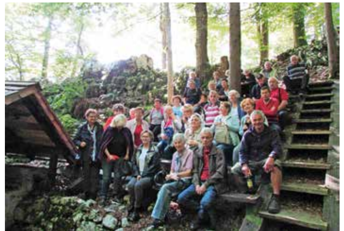
Na mitingu v Pangršici

Na letošnji izlet smo se odpravili v bazo 20. Letos mineva 80 let od izgraditve tega sedeža vojaškega in političnega vodstva slovenskega narodnoosvobodilnega gibanja. Ta je deloval sredi vihre druge svetovne vojne v temnih gozdovih Kočevskega roga. Je edini na tako skriven način zgrajen in ohranjen sedež vodstva kakšnega odporiškega gibanja v Evropi. Zaradi izjemnih varnostnih ukrepov ni bil nikoli odkrit. V skupno 26